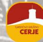
Turistično društvo CERJE