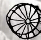
društvo žensk ŽBRINCA