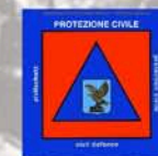
Civilna zaščita Doberdob - Doberdò del Lago