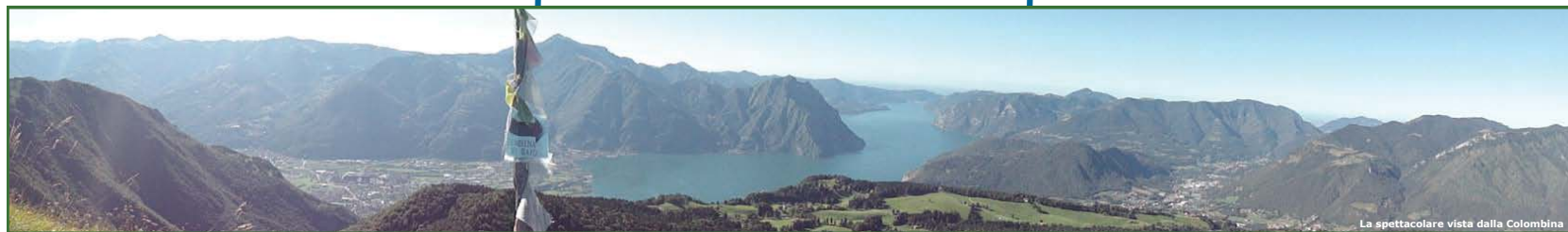
La spettacolare vista dalla Colombina